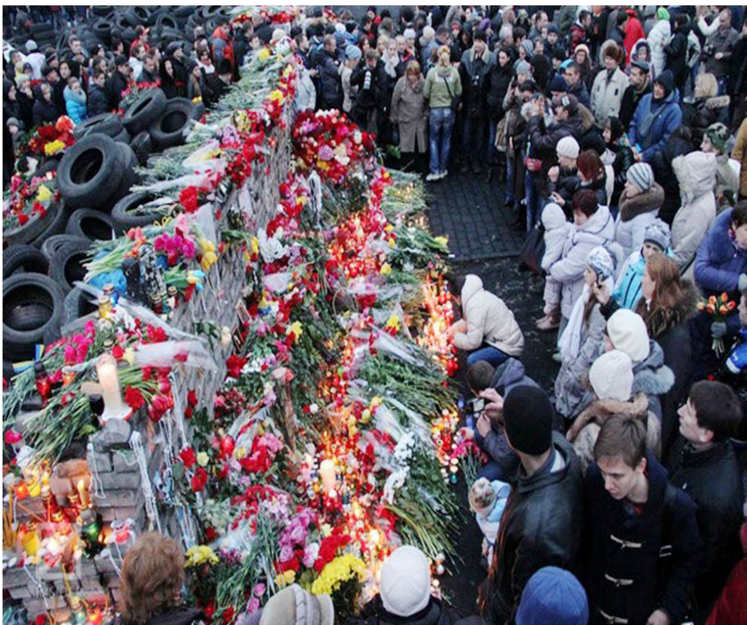
23 лютого, квіти Небесній сотні. Фото Віктор Гурняк, Insider

В.1. Після переговорів між президентом В. Януковичем і представниками опозиції за посередництва представників Євросоюзу та Росії було підписано Угоду «Про врегулювання політичної кризи в Україні». Офіційна влада України юридично визнала жертвами загиблих мітингувальників Євромайдану. Цього дня на Майдані відбулося прощання із загиблими.