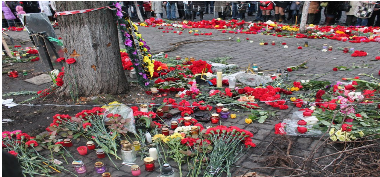
Слайд 2. Небесна сотня: Герої не вмирають

На білому світі є різні країни, Де ріки, ліси і лани. Та тільки одна на землі Україна, А ми її доньки й сини. Усюди є небо, і зорі скрізь сяють, І квіти усюди ростуть. Та тільки одну Батьківщину ми знаєм. Її Україною звать.